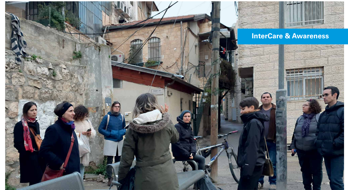
InterCare & Awareness